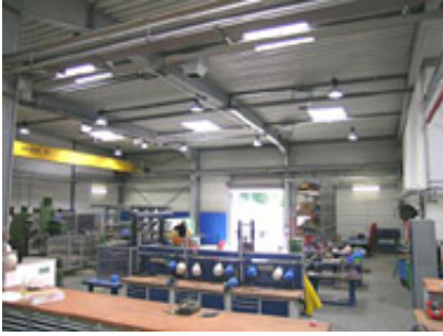
Blick in die Werkstatt