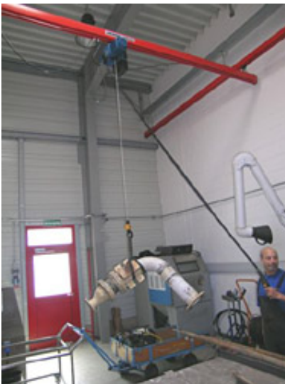
Arbeitsplatz mit Tragehilfe