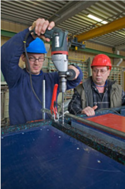
Montage der Form