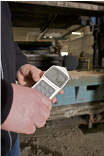
Nur max. 85 dB(A) werden beim Rüttelvorgang gemessen.