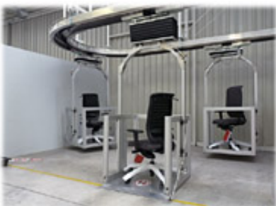
Transportanlage - heute