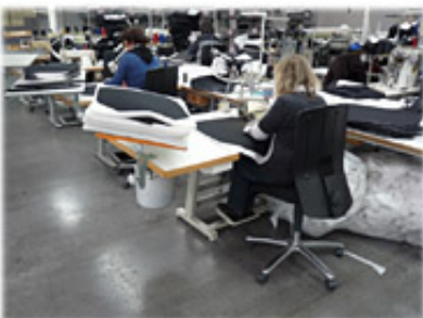
Näharbeitsplätze ergonomisch gestaltet