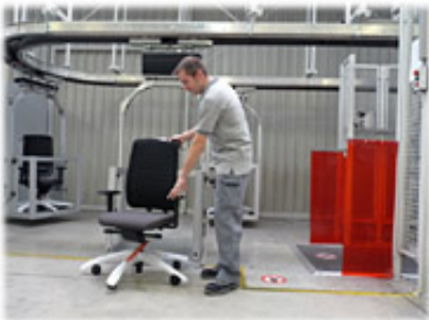
Transportanlage - früher