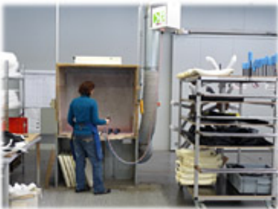
Lösemittelhaltige Klebstoffe durch lösungsmittelfreie Klebstoffe ersetzt