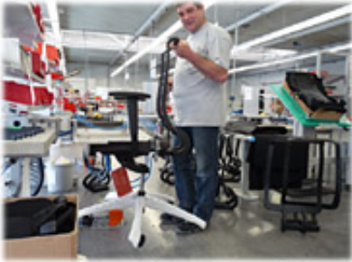
Montieren von Bürostühlen - heute