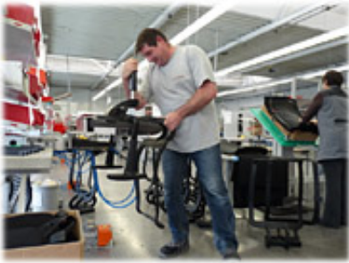
Montieren von Bürostühlen - früher