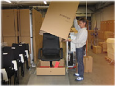
Versand - heute