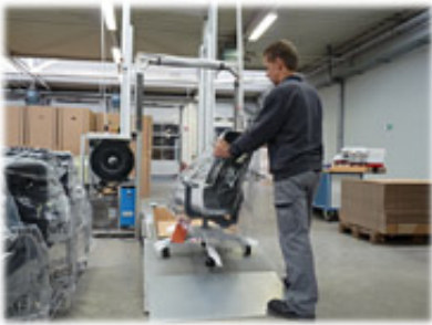
Versand - früher