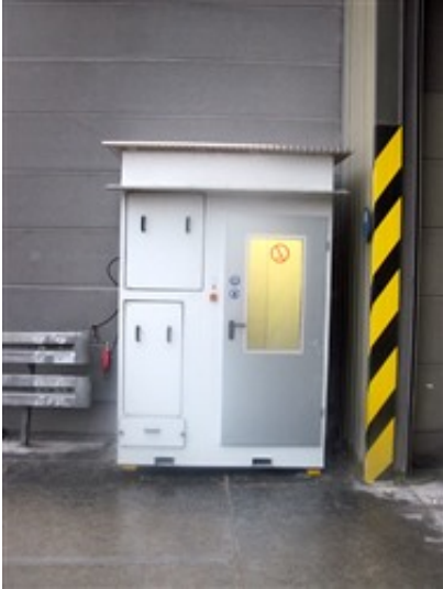
Anschaffung einer Luftdusche