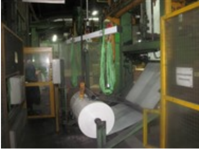
Kran zum Folienwechseln an der Verpackungslinie