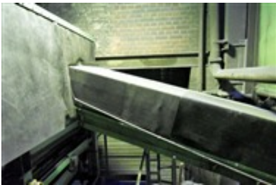
Einhausung der Presse zur Staubreduzierung