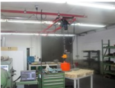
Kranschiene als Hebehilfe für den Formbaukran