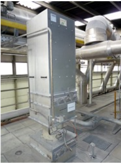
Ofenventilator mit Schalldämpfer