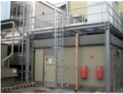
Rückenschutzbügel an Steigleiter