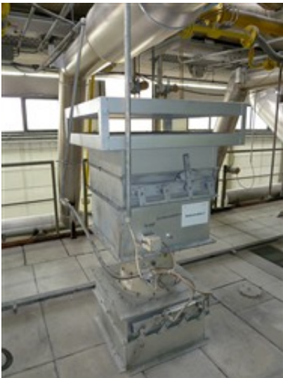
Ofenventilator ohne Schalldämpfer