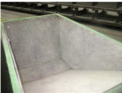
Gummiauskleidung der Kippkübel