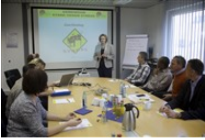
Moderierter Workshop „Gemeinsam gegen Stress“