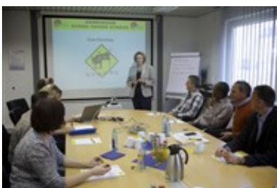
Moderierter Workshop „Gemeinsam gegen Stress“