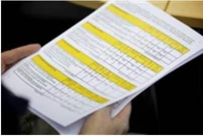
Fragebogen zu psychischen Belastungen