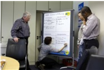
Ausarbeitung von Lösungen