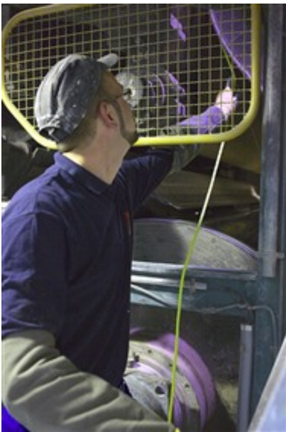
Einziehen des Aufführseils