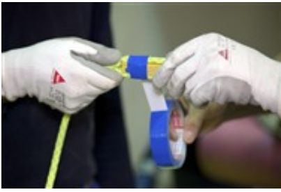
Anbringen des Aufführseils an den Magneten