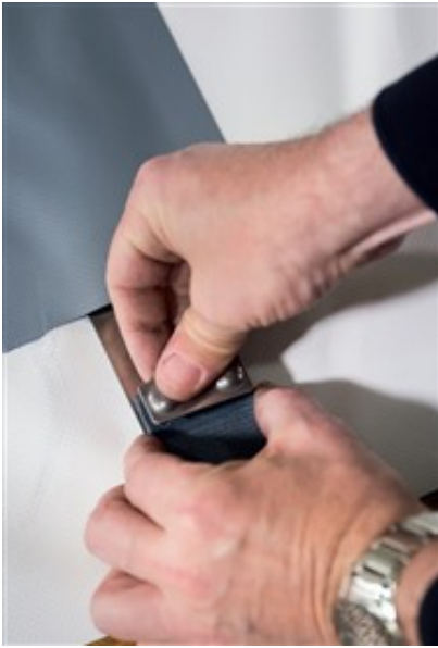
In die Plane integriertes Stahlband.